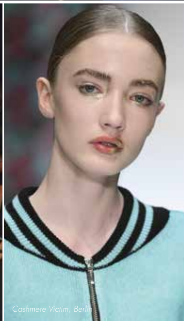
Cashmere Victim, Berlin