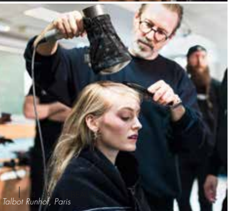
Talbot Runhof, Paris