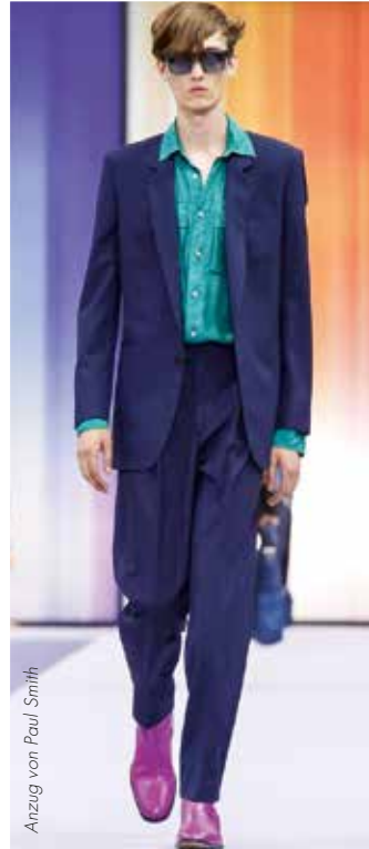
Anzug von Paul Smith

Die sommerliche Trendprognose: Es wird frisch! Dafür sorgen neue Looks und starke Farben.