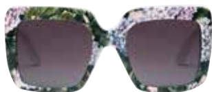
Sonnenbrille: Dolce & Gabbana Sneakers: Nike von net-a-porter.com