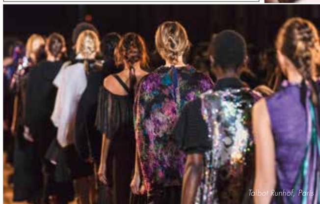
Talbot Runhof, Paris