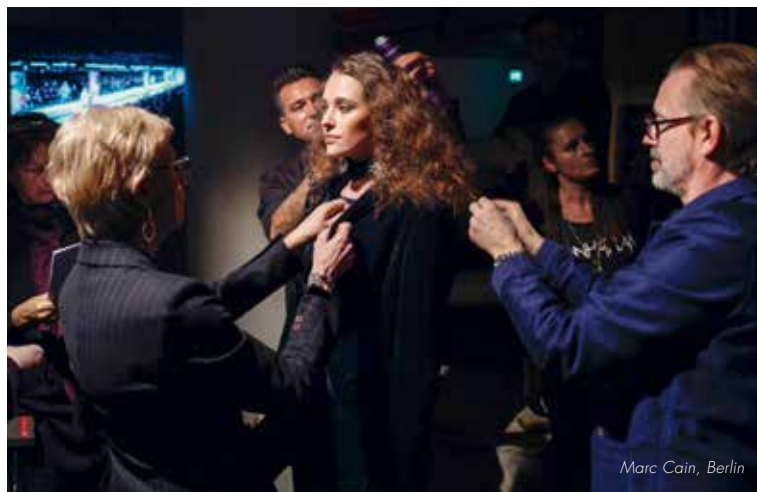
Marc Cain, Berlin