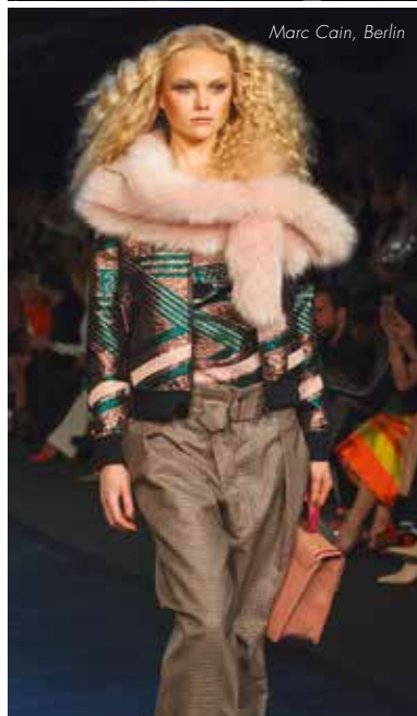
Marc Cain, Berlin