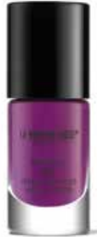
Brilliant Nail Fuchsia von La Biosphère