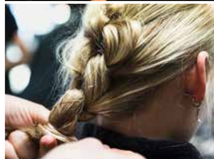
Talbot Runhof, Paris