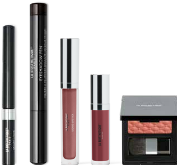
Smart Liner Navy Blue Eyeshadow Pen Pure Ebony Liquid Lipstick Desert Rose Cream Gloss Pretty Mauve Tender Blush Coral Blossom